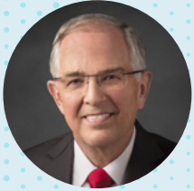
Élder Neil L. Andersen Do Quórum dos Doze Apóstolos